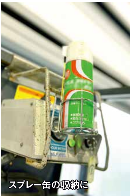
スプレー缶の収納に