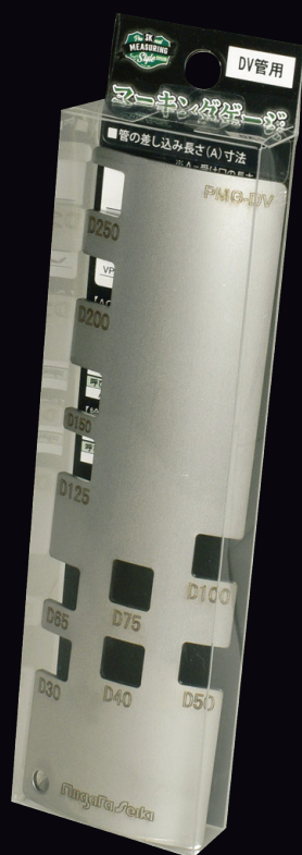
排水用塩ビ管 (DV) 用