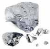
半導体の材料となる「石」