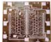
電卓用MOSIC(HD701:16ビット・シフトレジスタ)