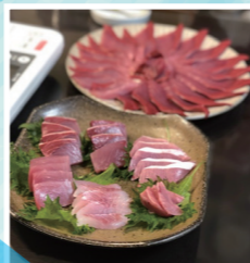
このブリがこうなりました